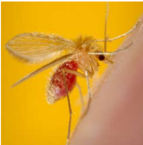
Die Sandmücke infiziert mit Leishmanien.

Sie werden durch Sandmücken übertragen und können auch in europäischen Mittelmeerländern vorkommen. Insgesamt ist das Vorkommen selten und sehr selten kommt es zur Infektion bei Touristen. Allerdings können sie dann zu einer sehr schwer verlaufenden und schwer behandelbaren opportunistischen Infektion führen. Die Diagnose